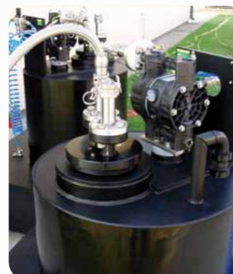
Sósav szállítása ATEX környezetben